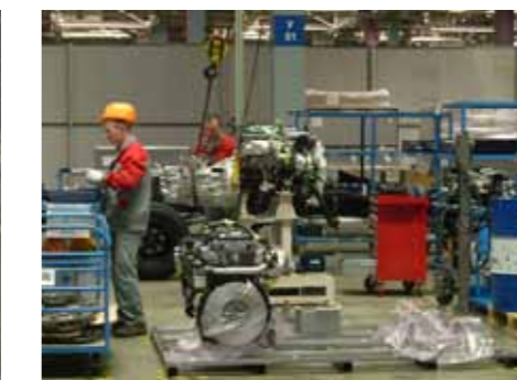
Так выглядит современное сборочное производство