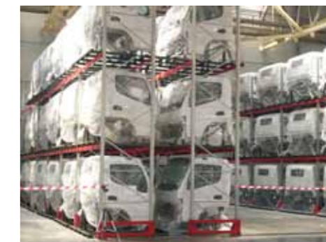
Японская аккуратность – каждая кабина в индивидуальной упаковке

Сборка японских грузовиков грузоподъёмностью 4,5 т – весьма неординарный шаг для холдинга из Набережных Челнов. В гамме про-