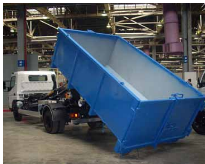
На шасси Canter возможны самые разнообразные надстройки

24 мая на автогиганте в Набережных Челнах праздновали рождение 1000-го автомобиля. Но на этот раз это был не КАМАЗ, а малотоннажный грузовой автомобиль Mitsubishi Fuso Canter.