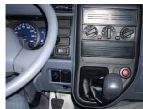
Такая «архитектура» рычага КП делает более удобной посадку пассажиров на двухместном диване