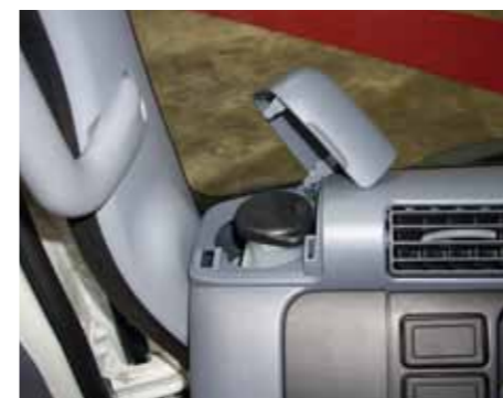
Разве бывает на «японцах» иной доступ к питательному бачку гидропривода тормозов и сцепления?